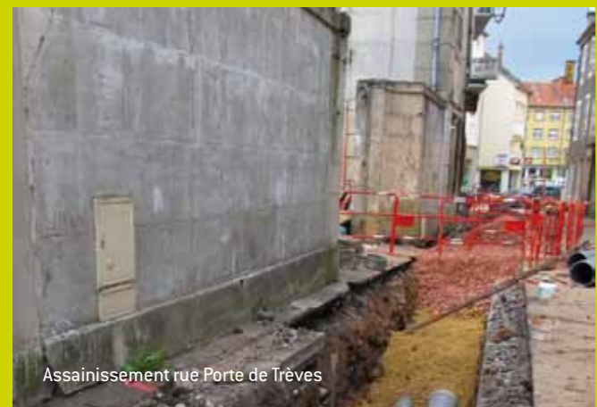
Assainissement rue Porte de Trèves