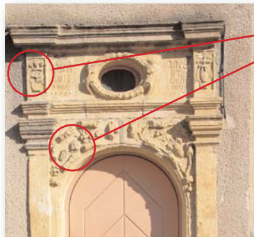
n°4 Maison Kettenhofer (1602) - Boucher

Attributs de boucher Attributs viticoles