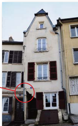
n°7 Maison Hubert Hein et Marie Montenach (1562) - Tanneur

La présence d'attributs viticoles se justifie par la production ancienne de différents vins dans la vallée de la Moselle, à l'intérieur des trois pays limitrophes (France, Luxembourg et Allemagne) ; les vins de Moselle. D'ailleurs, en France, depuis 2010, le vignoble de Moselle a été classé AOC Moselle.