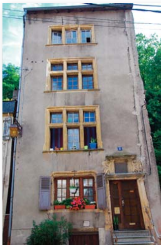
n° 4, rue de la Tour de l'Horloge (1624)

Directement sur votre gauche, au n°4, remarquez une maison haute et étriquée. C'était autrefois la demeure du drapier Berweiller. Sa boutique occupait le rez-de-chaussée surélevé en raison des fréquentes inondations.