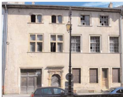
n° 3, rue du Moulin (1607)